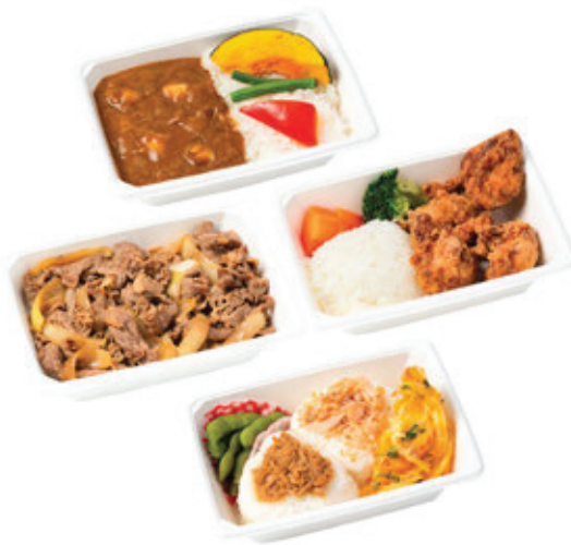
種類豊富な冷凍弁当パック

2012年に創業した株式会社こんぺいとう (KOMPEITO Inc.) は、日本国内で「OFFICE DE YASAI」という設置型の健康社食サービスを展開し、累計1万3000拠点以上に導入してきた実績を持つ。社員の健康と食生活を支える同社は、2024年にアメリカへ進出。米国法人KOMPEITO USA Inc.を設立し、新たに「Lumeal」という冷凍・冷蔵社食サービスの提供を開始した。