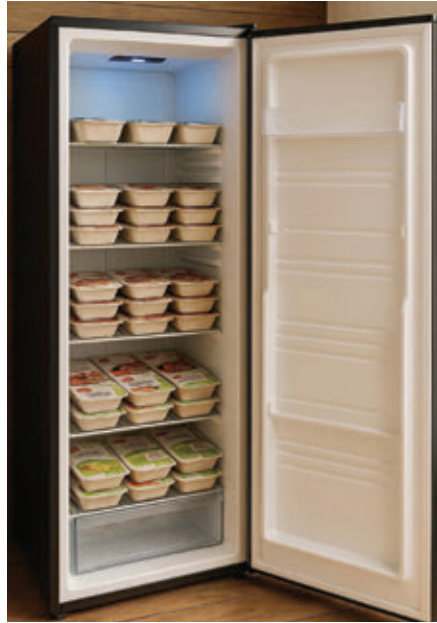
オフィスに設置する冷凍庫

「Lumeal」は2024年2月からサービスを開始。オフィスに設置された専用冷凍庫から、社員が好きなタイミングで食事を取り出し、スマートフォンでQRコードをスキャンして決済、電子レンジで温めてすぐに食べられる仕組みだ。おにぎりBoxやチキンテリヤキ弁当など、バラエティ豊かな冷凍パックを用意し、1食約5ドルという手