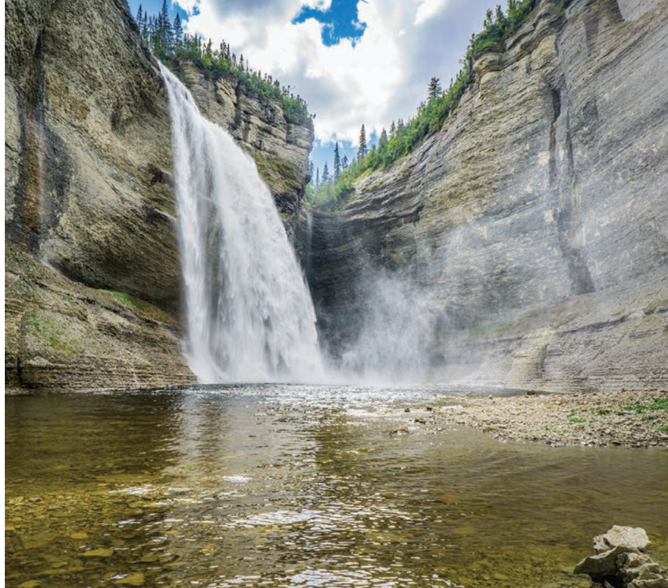
峡谷に位置するヴァウリアル滝の、春から夏にかけて豪快に水が流れ落ちる美しい光景は必見。島には約16万頭のシカが生息しており、あちこちでシカの群れを見ることもできる

アンティコスティ島に来たらぜひ体験して欲しいのが化石を見られるツアー。地質学者や自然ガイドが同行して島の特徴やこ