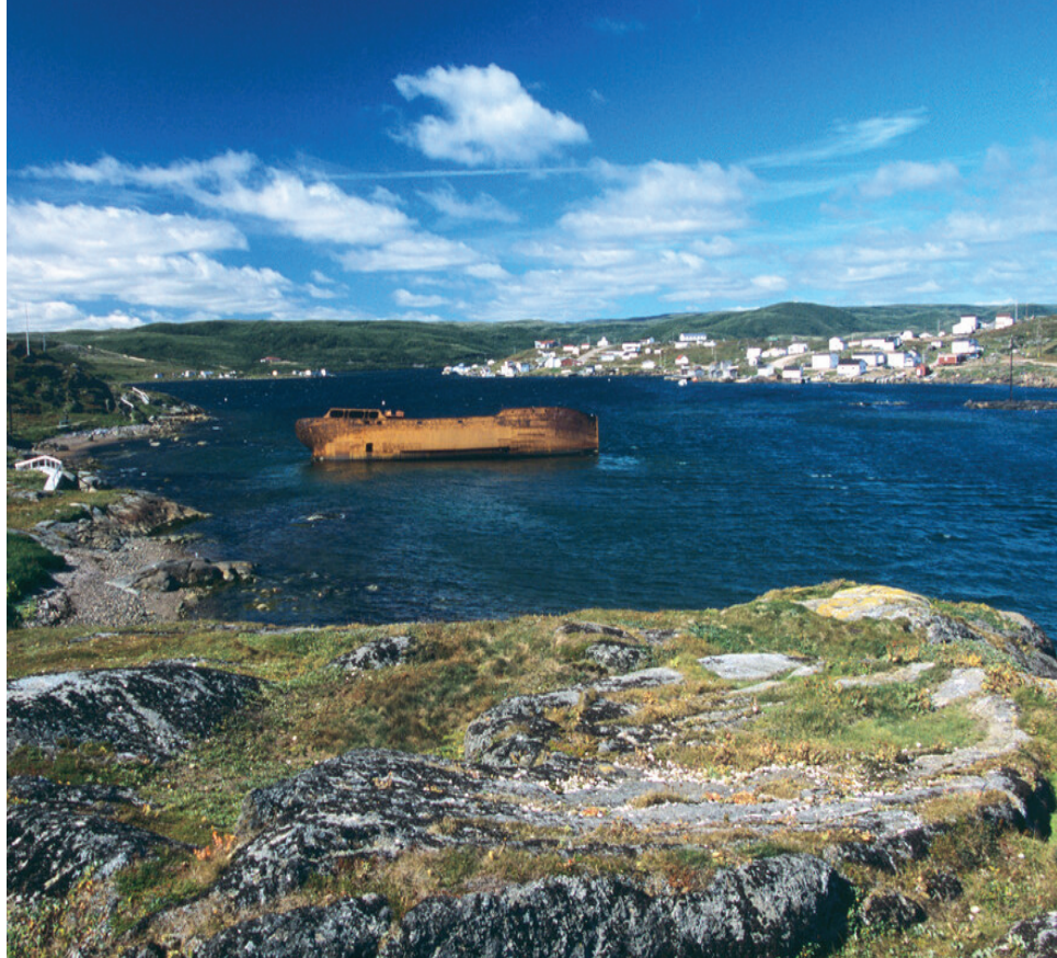
ラブラドール半島のベルアイル海峡沿岸に位置するレッドベイには、16世紀に繁栄したバスク人による捕鯨基地が今も当時の様子を語り継いでいる

文/ 齋藤春菜 ● 物流会社で営業職、出版社で旅行雑誌の編集職を経て渡米。思い立ったら国内外を問わずふらりと旅に出るは、その地の文化や人々、景色を写真に収めて歩く。世界遺産検定1級所持。