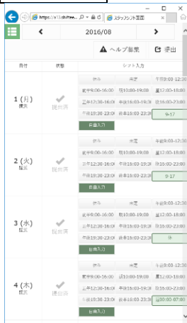
サンプル画像① シフト希望入力画面（スタッフ用画面） http://www.sts-inc.co.jp/files/20160905_shiftee01.png

SHIFTEE では、スタッフのメールアドレスを登録することで、スタッフに対するシフト希望提出依頼などの連絡事項を一斉送信でき、スタッフはそれに対してスマートフォンなどでシフト希望を出すことができます。これにより、スタッフがわざわざ施設まで来てシフト希望を提出する必要がなくなりました。