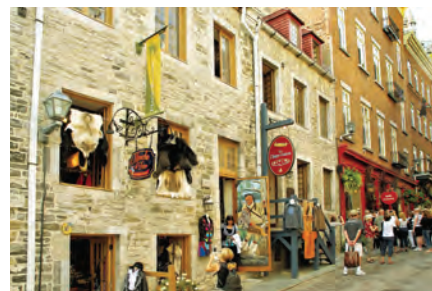
上/ケベック旧市街。中央にそびえるのはお城のようなシャトー・フロントナック 左下/中世ヨーロッパを彷彿とさせるロイヤル広場 右下/ブティックや雑貨店で掘り出し物を見つけよう