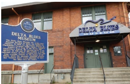
ミシシッピ州デルタ地帯で生まれたブルースの起源が分かるミュージアム

むせぶようなギターのと響きと魂に届く深い声、誰でもああこれこそブルースと思えるマディ・ウォーターズの音楽。彼の育ったクラークスデールの町には、「デルタ・ブルース・ミュージアム」があって、館内に彼の育った家が再現されている。この伝説的なミュージシャンは、当時、綿花畑の小作人として働き、どちらかという掘っ立て小