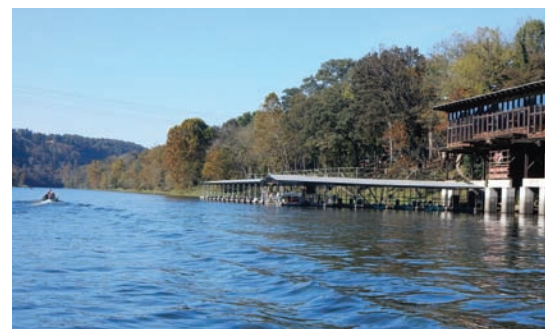
ホワイト川のアちこちで釣り糸を垂れているポート

ミシシッピ川に沿っているアーカンソー州には、その支流であるホワイト川やブラック川が流れる。4種類ものトラウトが生息するホワイト川は、釣りで有名。川のほとりに400エーカーもの敷地が広がる「ガストンズ・ホワイトリバー・リゾート」は、59年の歴史を誇るリゾートで、ここに泊まって朝から釣りを楽しむ人で賑わっている。釣った魚をレストランで調理もしてくれるから、上手くいけば釣り果でおいしいご飯にありつけるかも。