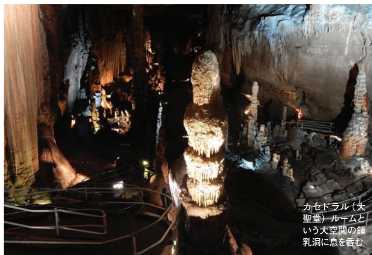
カセドラル(大聖堂) ルネムという大空間の鍾乳洞に息を呑む

アーカンソー州には、全米で唯一、米国森林局 (US Forest Service) が管理をしているという「ブランチャード・スプリングス洞窟」がある。エレベーターで地下約111mまで下りるとそこには驚くべき鍾乳洞の大空間が待っている。洞窟ツアーに参加すると鍾乳洞の成り立ちや歴史を解説してくれる。この洞窟が発見されたのは1963年だが、この頃は冷戦時代でシェルターとして使うことを考えて洞窟探索が盛んだったそう。アメリカでも最大の幅を誇る鍾乳洞壁は圧巻。クリスマスなどでコンサートも開かれるとのことで、HPをオープンするとそんな荘厳な音楽が流れる。