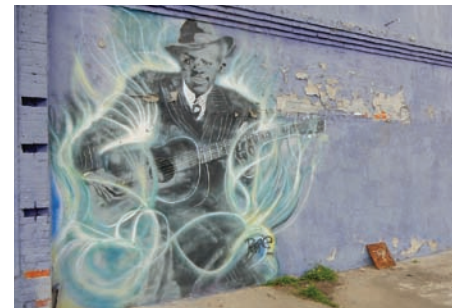
壁からブルースが聞こえてきそうなグラフィティ。クラークスデールの町で

ローリングフォークから1時間ほどのクリーブランドには、アメリカ国内でLAとここしかない世界的に有名なグラミー賞のミュ