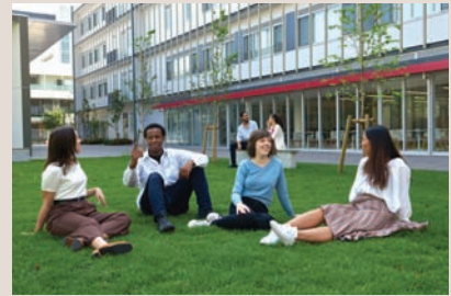
東京・世田谷区のTUJキャンパス

大学と同様に1回の受験の結果ではなく、高校時代の学力や共通テスト、語学力等から総合的に入学審査を行います。Common Appでの出願も受け付けています。国際人材を目指す強い意志を持った皆さんをお待ちしています。