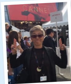
『オー・ルーシー!』が出品されたカンヌで