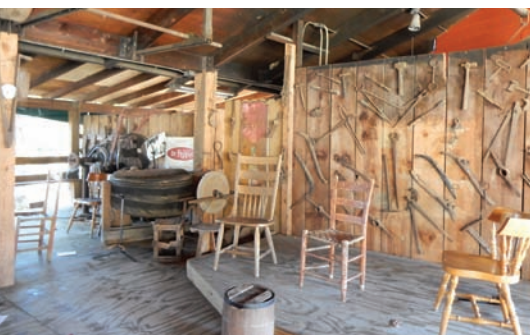
クラフトが飾る舞台上、バンジョーやフィドルが奏でられる

「オザーク・フォーク・センター」には、豊かな森を生かした樹上オリエンテーリングが楽しめる「ロコ・ロープス」という施設もある。地上10mの高さなので、安全のためにハーネスを着けて細い丸太の上を歩いたり、グラグラと揺れる吊り橋を渡ったりするのは、スリリングなだけではなくか