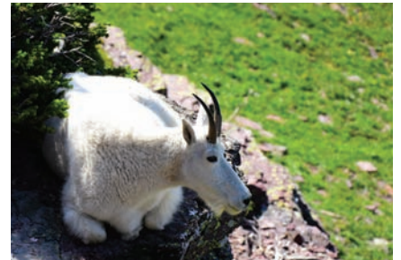
上/絵画のように美しいセントメアリー湖 左下/Go-to-the-Sun Roadは全長約50マイル、片道車で2時間ほど 右下/断崖で暮らすマウンテンゴートはロッキー山脈の固有種

テンゴートや、目の覚めるようなエメラルド色の湖など、非日常の贅沢な時間が楽しめるはず。